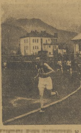
Przemyśl Bieg Narodowy to Zajączkowski