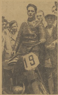
Hennek z katowickiej Pogoni okazał się jak zwykle bezkonkurencyjnym motocyklistą w najcięższej kategorii maszyn na eliminacjach do mistrzostw Polski, które odbyły się w sob. niedzielę w Warszawie.