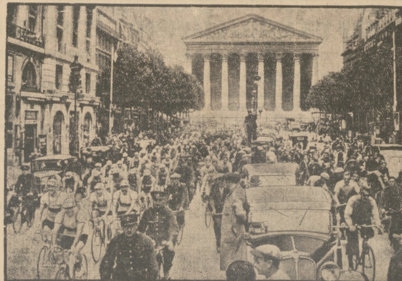
START DO „TOUR DE FRANCE”.

WYCIECZKI polowania autobus wynajmuje T-wo „Autotouch” — Sosno- wice, 1 Maja 23. tel. 3425 3.36