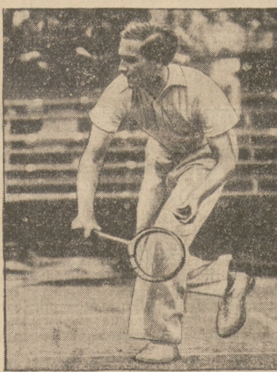
Perry, mistrz świata i mistrz Niemiec von Cramm, finalista zawodów tenisowych wimbledonu.