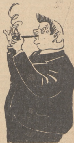
EDWARD HERRIOT. w karykaturze

Wyrok skazujący go na przewidzianą kodeksem najwyższą karę dla młodocianych, 10 lat więzienia, przyjął z tymym spokojem.