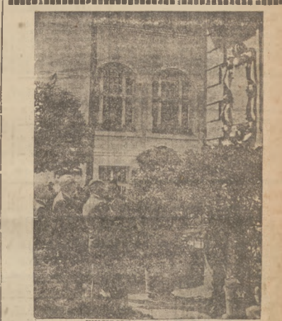
WYCIECZKA SENATORÓW R. P. NA ŚLĄSKU ZAOLZIANSKIM Grupa senatorów R. P. z marszałkiem Senat. pki Młodym na czele przed pływ. Marszałka Józefa Piłsudskiego w Jankowicach