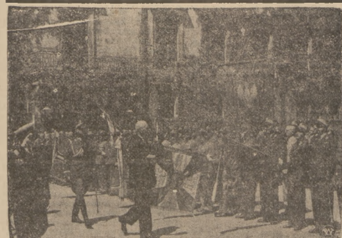
WARSZAWA. W PRZEDSIĘWZIECIU ARMII POLSKIEJ NA ZAMKU D. Chętny wrzucił sztandar w Warszawie na cmentarzu wawelskim złożył delega- tów, przybył na Zamek Królewski, celom słońca holdu Panu Prezydentowi Rzeczy- pospolitej prof. dr. Ignacemu Mościckiemu. Na zdjęciu P. Prezydent Rzeczypospolitej przy- trzymuje pociąg wstążki, który jest z ochotnikami armii polskiej.

— Jakto, nie słyszał pan, że nie wol- no tak krzycze!