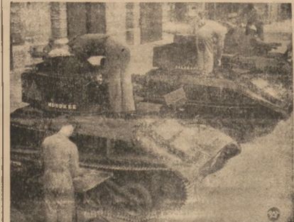
NOWE BATERIE CZŁOGÓW, /