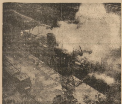
PAROWIEC TRANSATLANTYCKI „JA PAYETTE” W PŁOMIENIACH