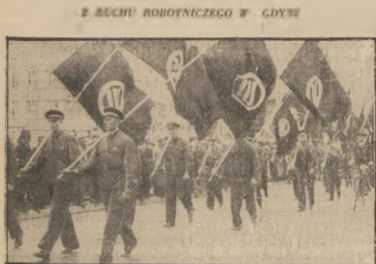
Fragment pochodu 1 maja 1938. Umundurowany oddział A. S.

Wiek XI i XII wiąże port gdański i ziemie gdańskie z Polską.