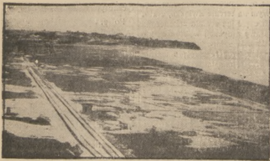
„PORT” GDYNIA 75 ROKU 1921

Rośnie i zmienia się Gdynia w tak szybkim tempie, że prawdziwie pisze i mówi tylko ten, kto mówi o Gdyni w czasie teraźniejszym, kto każdy przebieg siebie podany obraz - fotograficznie zaopatrzony w datę, z dokładnością jednej go dziny.