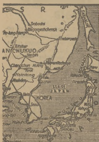
MAPA TERENU WALK.