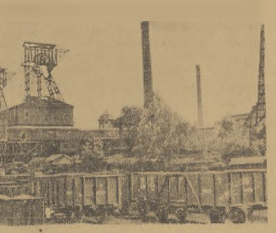
Widok ogólny kopalni „Pokoń” w Nowym Bytomiu. Ciężka kultura bohaterstwa drugina ratownicza uchroniła od zniszczenia. 11