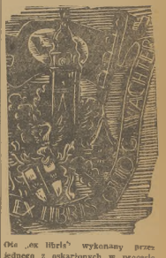
Ole „os Hlrbis” wykonany przez jednego z oskarżonych w procesie krakowskim WNI Langera dla m. str. bratowa Krakowa Wacławska. Rysunek przedstawia wstęgi na sznurze na tle flagi z swastyką.