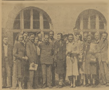
Wycieczka intelektualistów amerykańskich w czasie pobytu w Krakowie złożyła im w wizycie w krakowskiej organizacji EPS. Na zdjęciu goście w otoczeniu przedstawicieli WK PPS i tow. dzielnicy gmachu parli.