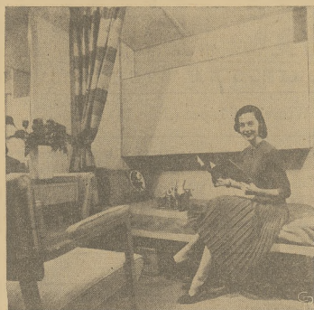
Zdjęcie przedstawia kabinę statku pasażerskiego, jaki kursuje między Stanami Zjednoczonymi, a Europą.