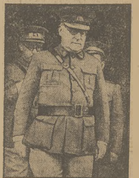
Gen. Miaja obrońca Madrytu.

Dwa wojskowe samoloty francuskie z Algera udały się w pościg za napastnikami, NIE ZDOŁAŁY JEDNAK JECH ODNALEĆ. Incydenty te wywołały wielkie wrażenie w Algierze. Delegaci żegl. marynarki handlowej oświadczyli, że wydali polecenie, by żalozki okrętów handlowych odmawiały wyjazdu na morze bez eskorty.