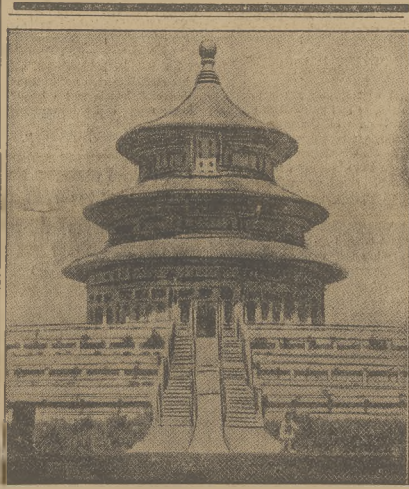
Obrazek z Pekinu

Główną kwatery lasztych starła się rzucić winę na samoloty rządowe korzystające z tego że zastatkowano prawdopodobnie przez pomyłkę również okręt włoski.