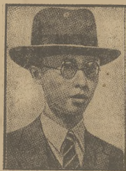
PU - YI CESARZ MANDZURI wysuwany przez pewne kółła na cesarza Chin Północnych.

Agencja Domei donosi: Według wiadomości z Hankau i Szanghaju wstąpiły Japończycy, mieszkający w dolinie rzeki Jang-Tse, zostali ewakuowani w obawie powtórzenia się wypadków, jakie zaszły w Tung-Czao (wymordowano tam wszystkich Japończyków).