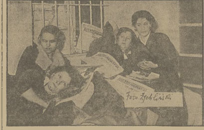
NOC PRACOWNIKÓW PIORA.

w rozmowie ze strajkującymi pracownikami „Dziennika Porannego”.