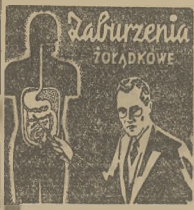
Se przysięga powiolenia ród arch eborak, adzebia opitw...