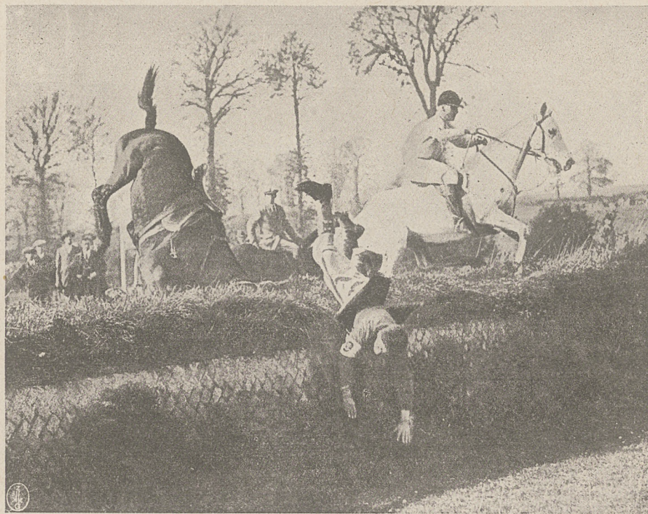
„..... i w miejscu tem drogi ich się rozeszły” — fatalny upadek w steeplechase w Anglii ilustrujący plastycznie znane to powiedzenie.