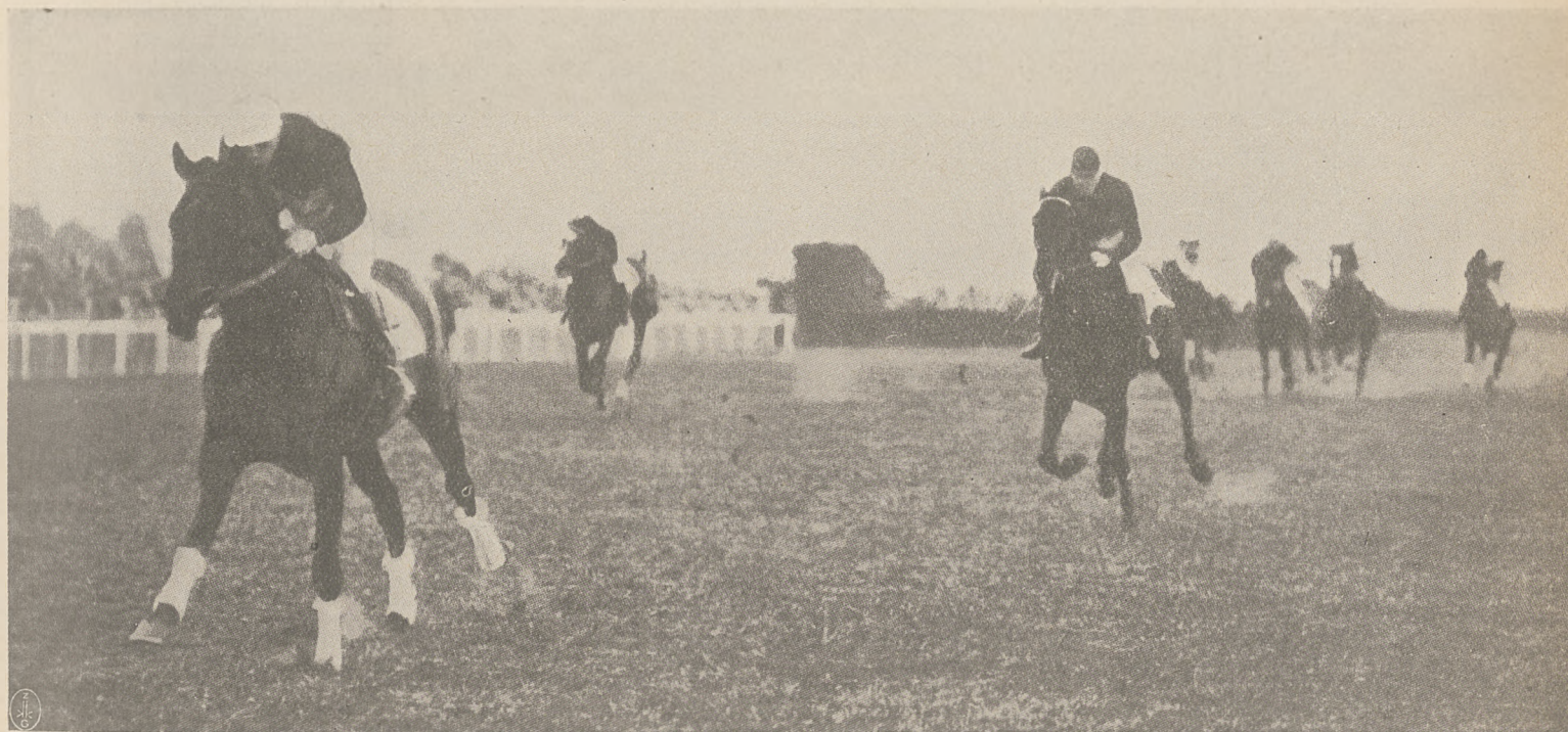
NICEA, Finish w Grand Prix de Monaco (100.000 fr. — 3500 mtr. Steeplechase).

Na tem kończymy rys organizacji hodowli koni