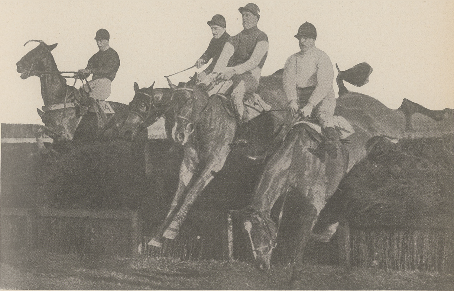
Wyścigi przeszkodowe i myśliwskie odbywają się w Anglii przez całą zimę; podajemy fragment z Wilts'Chase w Newbury.

Straty w produkcji konia szlachetnego nie są rzeczą nową, datują się od całego szeregu lat, nie powstrzymały jednak postępu w hodowli. Ma to swą przyczynę, opartą na bardzo nierealnej podstawie, a mianowicie na sentymencie ziemianina do konia i jego hodowli. Na tym właśnie sentymencie wygrywa administracja armji, wyznaczając ceny niskie, pokrywające zaledwie w części koszt