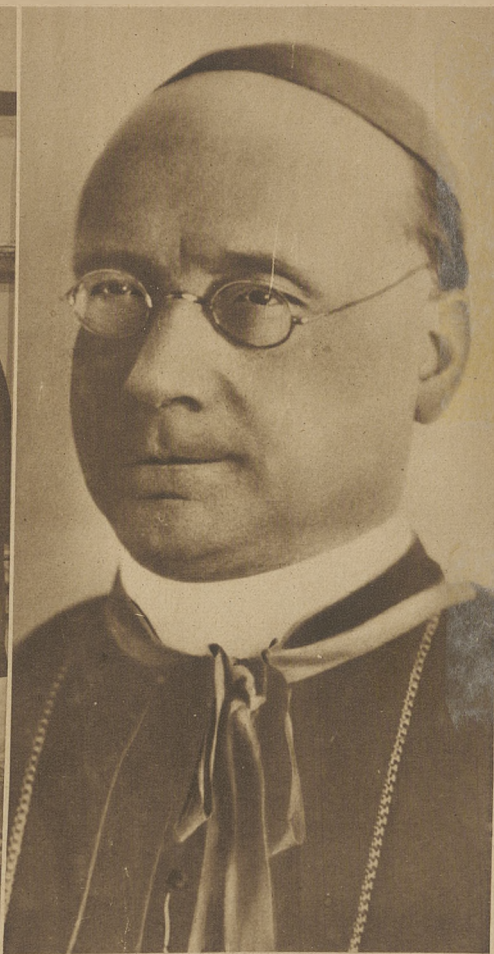
Dnia 14 bm. przyjechał do Warszawy nowomianowany nuncjusz papieski w Polsce, Monsignore Marmaggi.