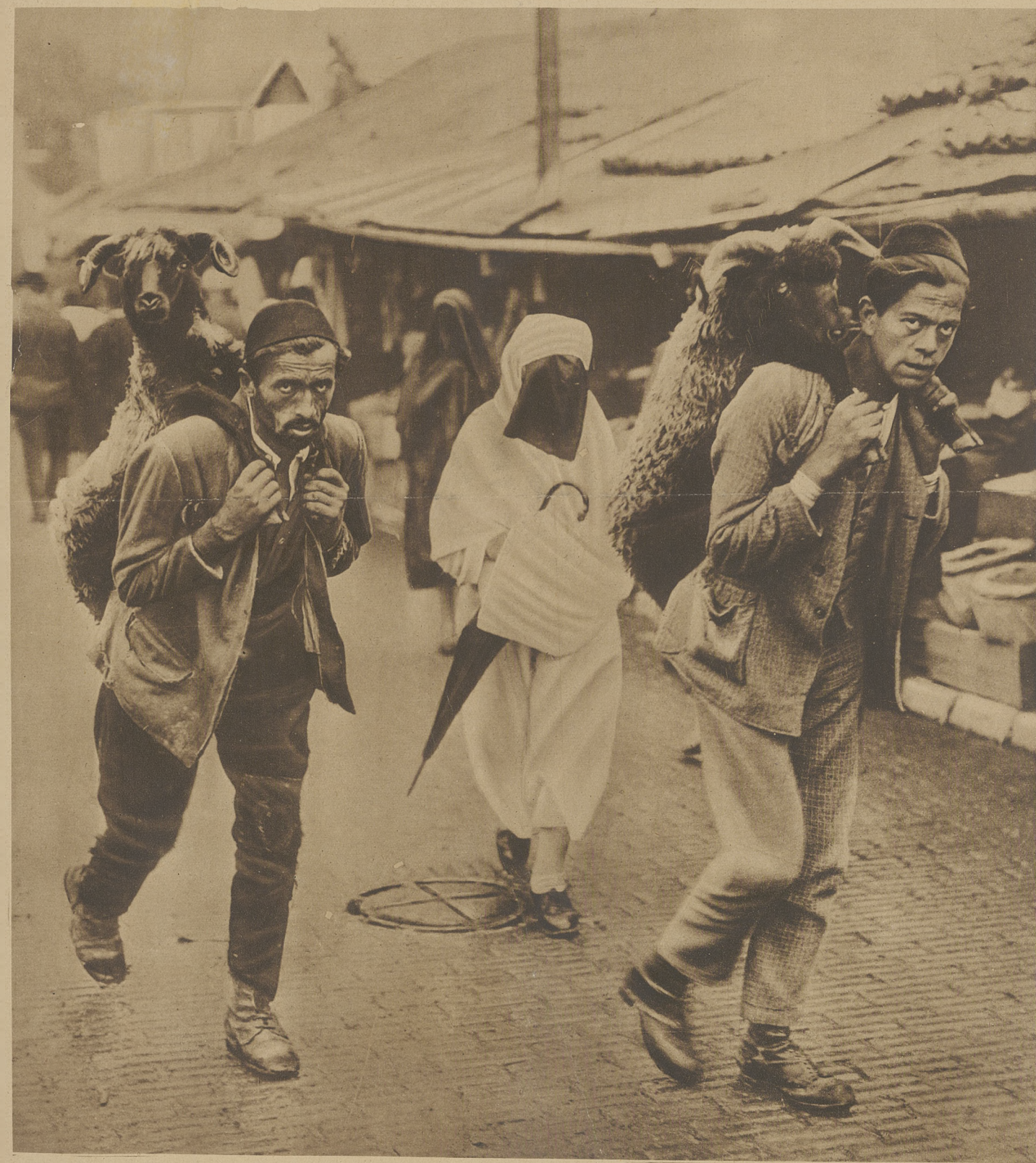
Interesująca scena z Sarajewa w Jugosławji. Dwaj Turcy niosą na plecach owce na farg. W głębi postać kobieca z zasloną na twarzy.

Sosnowiec, Niedziela, dnia 18 Marca 1928 r.