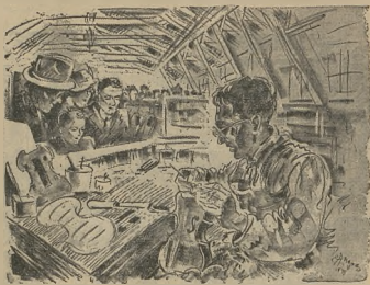
Ein Geigenhauer bei der Arbeit