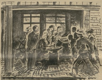
Muster-Schmiede in vollem Betriebe.

Es würde zu weit führen, wenn ich mich mit allen unseren Erlebnissen befassen würde. Ich will mich deshalb ganz kurz fassen und nur das Wichtigste herausgreifen. Der Rundgang durch die Ausstellung gab eine derartige Fülle von Betrachtungen, wie wir sie wohl selten in dieser Art zu sehen bekommen werden. In 14 Hallen werden uns die schönsten handwerklichen Erzeugnisse der daran beteiligten Staaten vor Augen geführt. Aber auch der geschichtliche Aufbau des Handwerks, sowie die handwerklichen Schöpfungen in den Jahrtausenden werden uns gezeigt. Musterwerkstätten, internationale Konditoreien, 1 ungarisches Restaurant, 1 internationaler Verkaufspavillon sind nur einiges aus der großen Schau, worin sich das Handwerk aus der Welt zusammengefounden hat, um seine Spitzenleistungen der Gegenwart zu zeigen. Gebannt steht der Besucher mitten in der Welt und im Wesen des Handwerks. Mancher Laie konnte erstmalig in die wirkliche Arbeit der Handwerks-