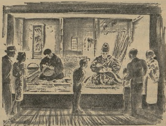
Der kaiserliche japanische Bogenmacher und ein Korblechter in der „Internationalen Landerschau“.

werkstatt schauen und erkennen, welche Mühe und Hingabe für die Herstellung eines Gegenstandes erforderlich ist.