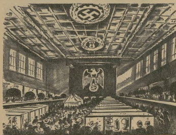
Die kulturhistorische Abteilung in der Haupthalle.

Einen schönen Eindruck machte auf uns auch der Besuch des Hauses des Deutschen Handwerks in der Neustadt.