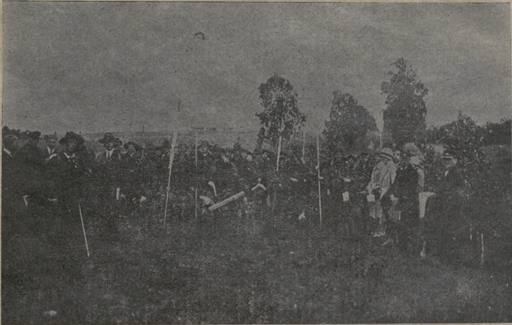
Lietuvių skautai ant demarklinijos (apie 20 žingsnių Nepr. Lietuvos pusėje).