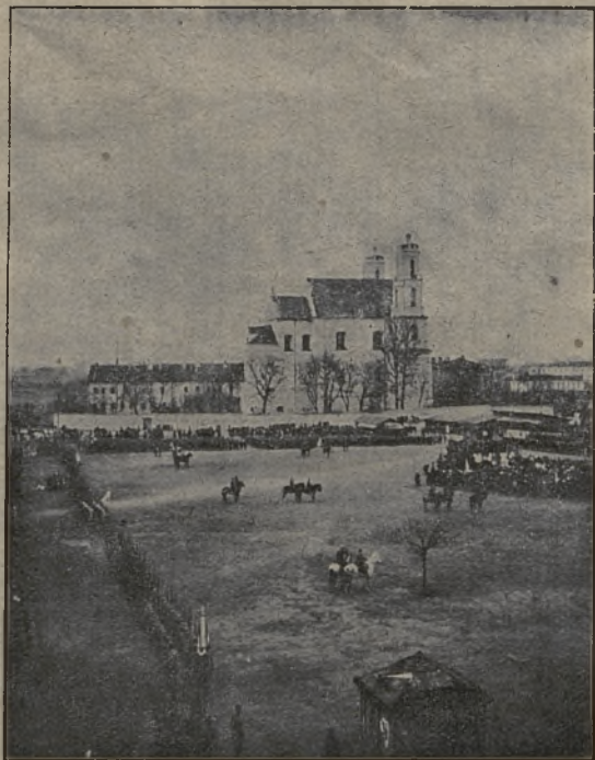
Lukiškių aikštė [ir šv. Jokūbo bažnyčia Vilniuje.

juos šalin, o ne žaisti su pavojum ir nemėginti, ar pataikys į mus paveikti ar ne. Jeigu tikrai galime, vėjame šalin nuo savęs ir nuo mums brangių asmenų vagį ar žmogžudį, tat taip pat pasielkime ir su blogu laikraščiu, ar knyga, nes jie yra vienu ir kitu žmogaus dvasiai.