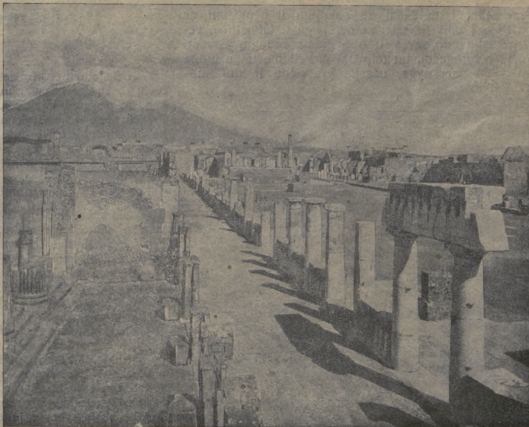
Senajo rymėnų miesto, Pompejos, griuvėsiai.

Laikraštis ir knyga daro įtakos į kiekvieną žmogų, tačiau daug didesnės įtakos daro į jaunuomenę, dar neprityrusią, neturinčią dar pastovaus, išdirbto pagrindo ir pažiūrų į gyvenimą. Taigi ypač jaunuomenė privalo atydžiai žiūrėti, ką ima į ranką, nes kartais viena knyga gali nulemti visą žmogaus gyvenimą, gali padaryti gyvenimą nepakenčiamu, kadangi pati yra nepakenčiama, arba geru, nes jie skelbia kilnius ir dorus pagrindus ir rodo apie juos kelią. Turime tat atydžiai žiūrėti, kad vieton draugo geros knygos ar laikraščio pavydale neįsibrautų mums į ranką nuodais ir neapykanta prie mūsų dvokiantis priešas, blogas laikraštis ar knyga, parašyta iškrypusio iš gyvenimo vėžių žmogaus, ar kokio nors nesąžiningo vertelgos, kuris įvairiomis „idomiomis“ nemorališkomis