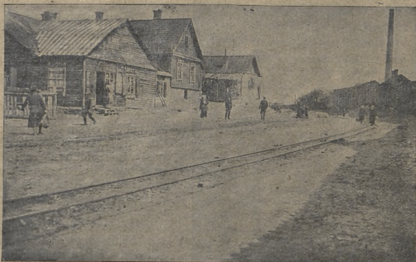
Naugardėlio gatvės reginys.