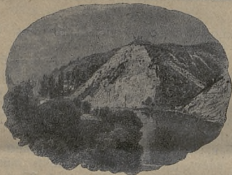
Trijų kryžių kalno reginys pradžioje XIX šimtmečio.