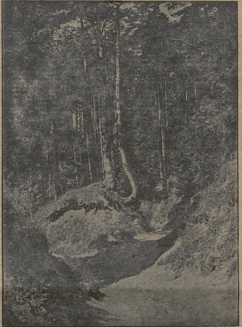
Mūsų miško vaizdelis.