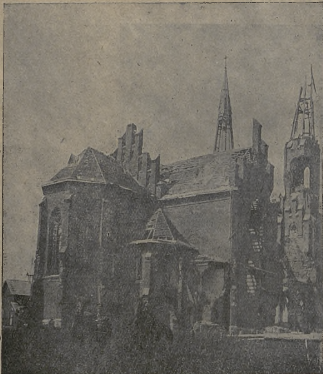
Katalikų bažnyčia Braslavės apskr.

— Jeigu jis dar iš proto neišsikraustė, tai pašutinis biaurybė...—suniurnėjo pulkininkas, žiūrėdamas į bankininką.