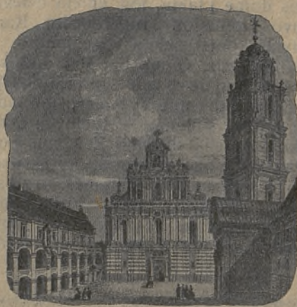
Šv. Jono bažnyčios reginys pradžioje XIX šimtme.

ko, Lenkijos delegacijos vicepirmininkas, ir pirminkautų šiai delegacijai.