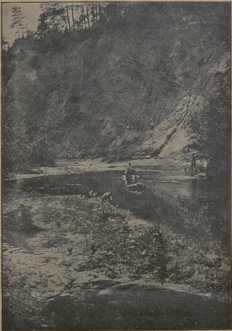
Mūsų krašto vaizdelis.

yra gryniausias melas ir nesusipratusiems akių dūmimos.