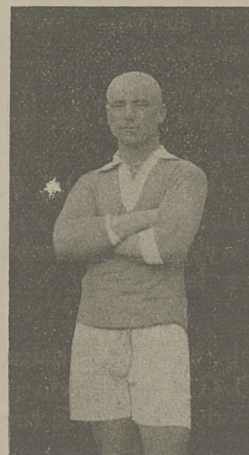
Ujpesti T. E.

Stella gnieźnieńska czerpie swe siły z garnizonu miejscowego. Poważnym przeciwnikiem w klasie A nie jest, mimoto zajmuje przy wielkiem szczęściu zaszczytne III. miejsce przez lekceważenie sobie jej przez przeciwników. Tylko śmiało naprzód ze zdrową ambicją sportową, a trud nie będzie poniesiony na próżno!