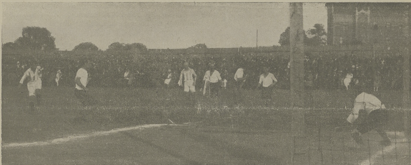
Z matchu Lwów—Kraków: Pod bramką Lwowa.

O tem niestety P. K. I. O. nie myśli. Pamięta