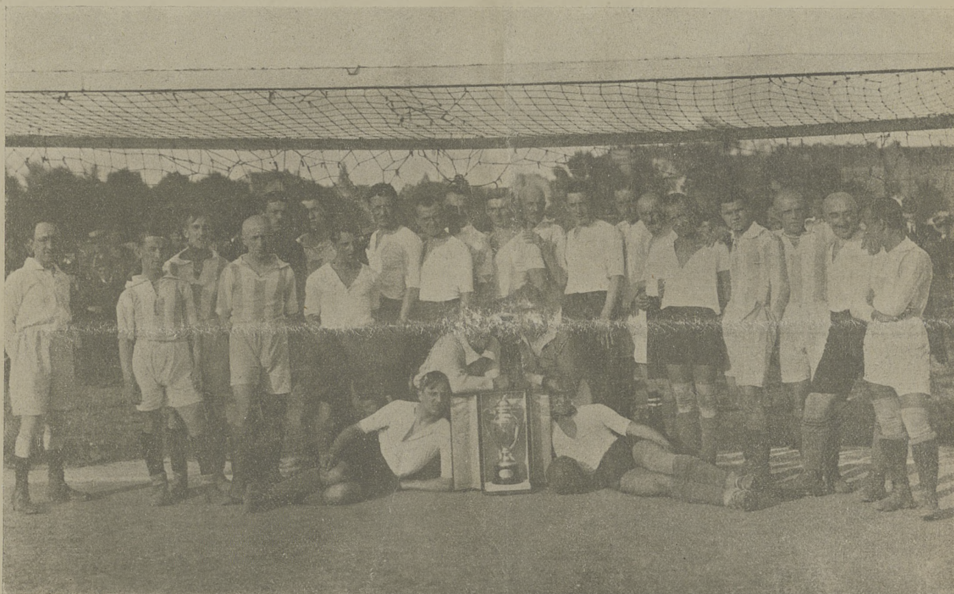
Reprezentacja Krakowa i Lwowa.

ESHAPE SPÓŁKA HANDLOWO-PRZEMYSŁOWA KAPITAŁ ZAKŁADOWY 5,000.000 MAREK