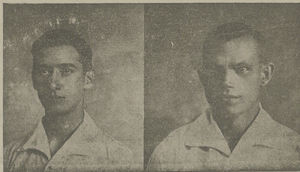
Ujpesti T. E.