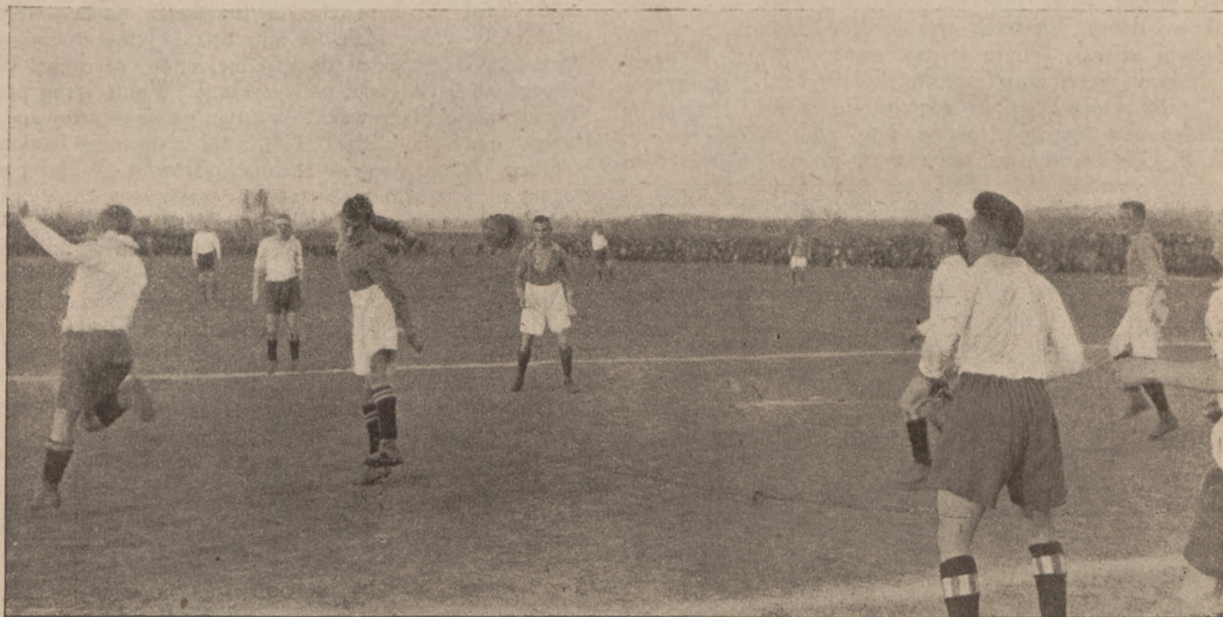
Z zawodów Warta—Unia (w Poznaniu, 23 kwietnia).

Warszawianka przewyższa swego przeciwnika zgraniem i techniką. Jedyną bramkę straciła z winy prawego obrońcy, (zapasowy). Przewaga przeważnie po stronie zwycięzców. Rogów 5:3 dla Warsz. Wojskowi uniknęli większej porażki dzięki dobremu bramkarzowi i pechowi w strzelaniu ataku Warszawianki. Publiczności sporo. Z.