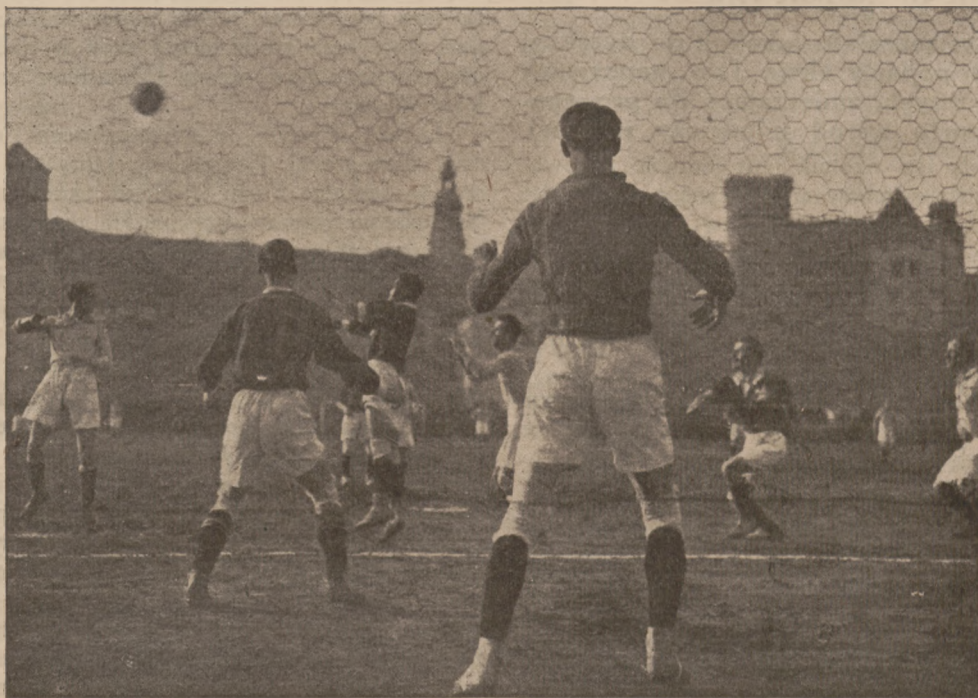
Z zawodów Wisła—Makkabi: Rzut z rogu przeciw Wiśle.