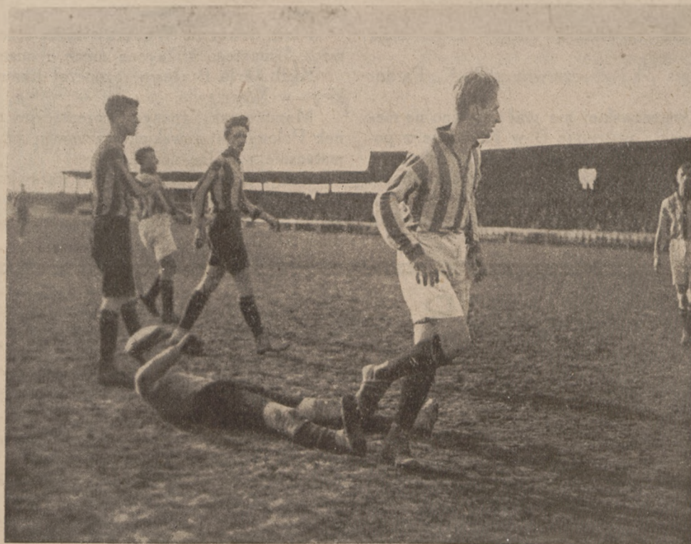
Moment z meczu Cracovia—Jutrzenka

W Warszawie odbędą się 3 mecze o mistrzostwo kl. A: Polonia—WKS (w sobotę), Korona—AZS (w niedzielę), Polonia—Warszawianka (w poniedziałek). Ponieważ Polonia ma już mistrzostwo pewne, przeto mecze powyższe wyjaśnią dalsze ugrupowanie w tabeli mistrzostwa. W klasie B są w programie 2 mecze: AZS II—Makkabi (w sobotę) i Warszawianka II—Polonia II (w niedzielę).