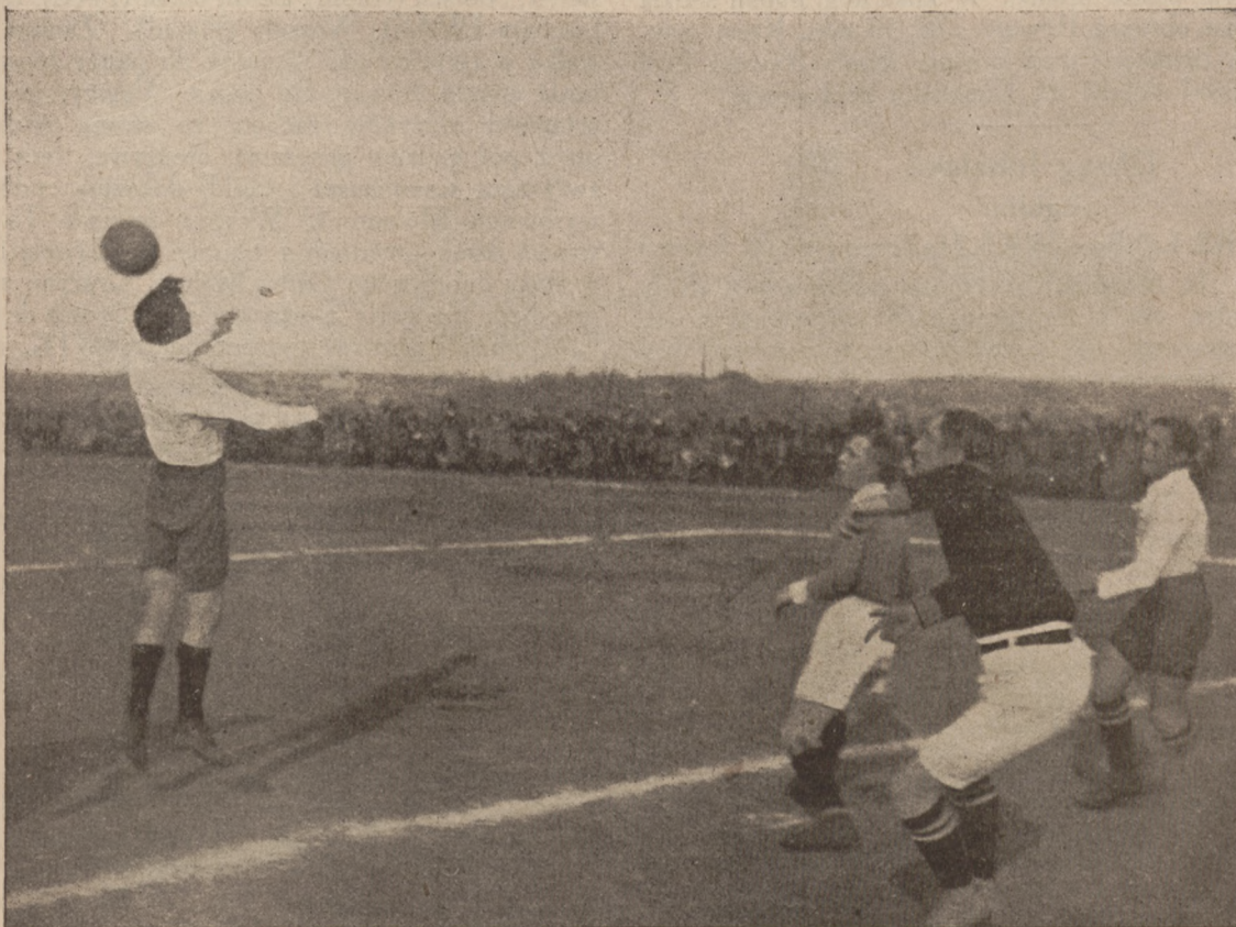
Z zawodów Warta—Unia w Poznaniu. Pod bramką Warty.

Polonia II. wystąpiła do powyższych zawodów wzmocniona