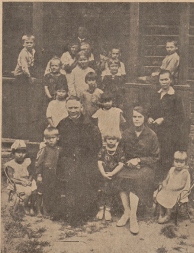
Lietuvių Šv. Kazimiero Dr-jos jaunimui auklėti ir globoti vaikų darželis Vilniuje.

— Bolševikai yra užėmę miestą Lin-kiangą, kur Sungari įplaukia Amuran. Dabar kiniečiai deda pbtangas išstumti bolševikus iš to miesto.