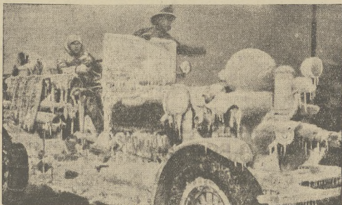
Samochód straży pożarnej, pokryty pancerzem lodowym, który uniemożliwił działanie pomp, powodując niezdatność samochodu do akcji ratowniczej.