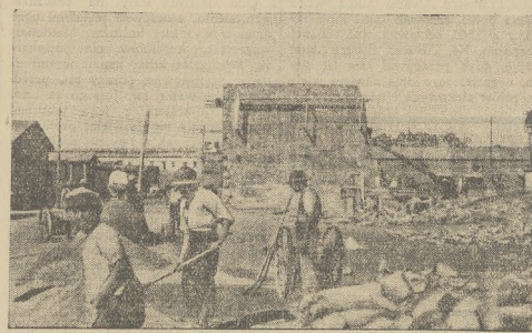
Wielkie zastosowanie samochodów ciężarowych na froncie północnym, skłoniło Włochy do zbudowania fabryki samochodów Fiat w Asmarze (Erytrea).