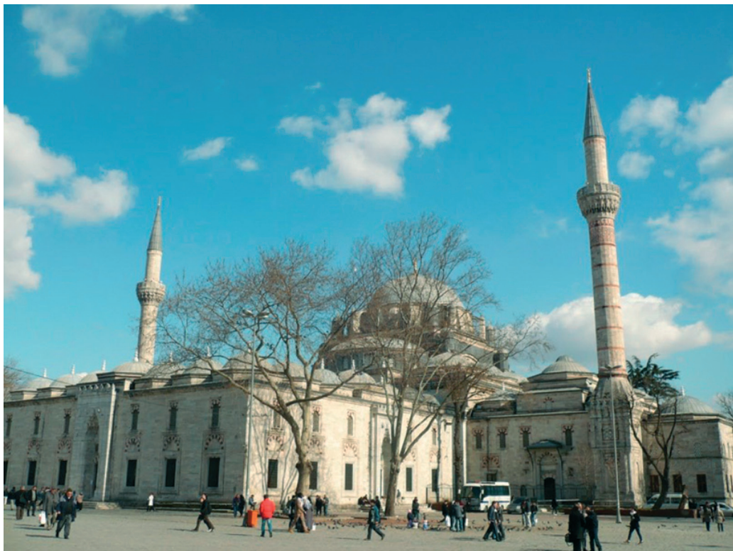
Il. Plac przed meczetem Bejazyda i biblioteką jego imienia.

Turkey, Istanbul, Beyazıt State Library, Sultan Bayezid II, Sultan Abdul Hamid II