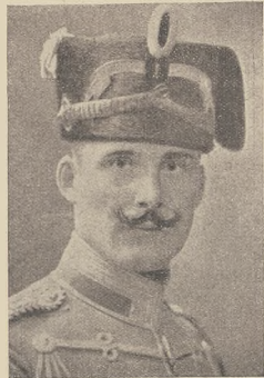
א טיבעט אריבער ערמאנדעם: לער ערמאנדעם: דר. געוועזענער