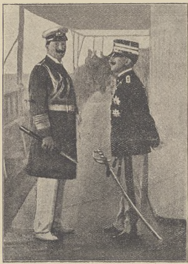
דער דרייבונד : קאזער ווילהעלם און קעניג וויקטאר עסטרייך.

דער דרייבונד האט אין דער נאנצער צייט בע- הערשט די אויפצאצאנען פאליטיק און ביי יעדען וויכ- טיגען ציאוניסטישן האט מען מיט איהם געמוזט רעכענען. אין די לעצטע יארען איז דאס סקרהעלסטנס ווייניגער עסטערנ-דאנערן און דייטשלאנד פון אונז דיש-